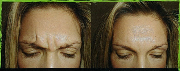
Лоб до процедуры – попытка нахмуриться (межбровье)